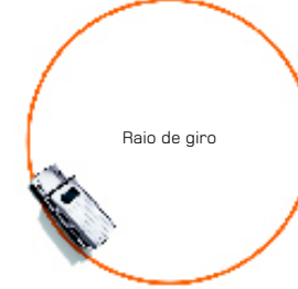
Raio de giro