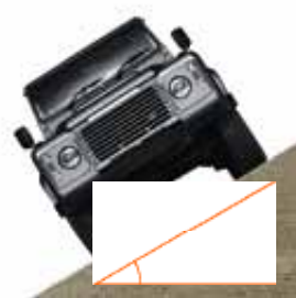
Inclinação máxima transversal, dependendo do peso de carga